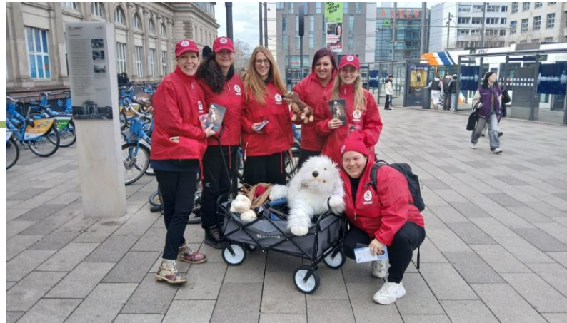
Flyerverteilkaktion mit Bollerwagen und Stofftierhund zum Illegalen Welpenhandel