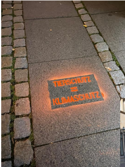
Sprühkreide Aktion in Kiel