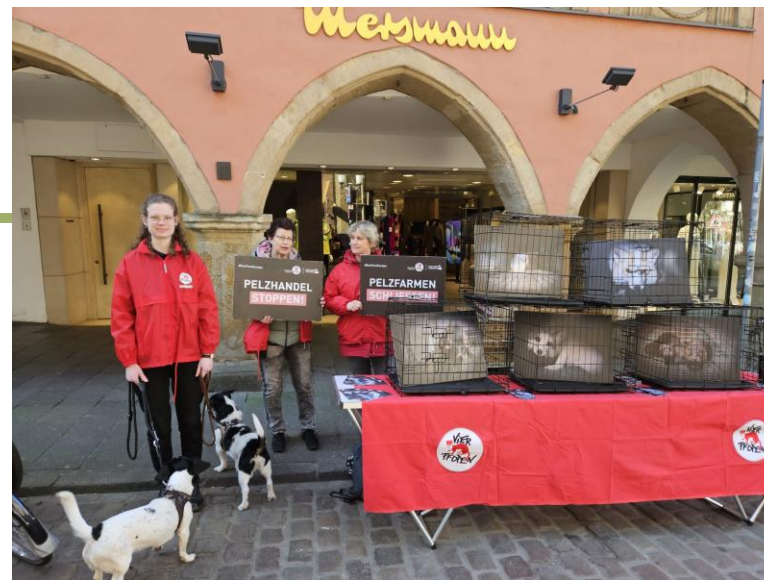
Mahnwache vor Pelzladen mit Käfigen, Tonaufnahmen und Handschildern