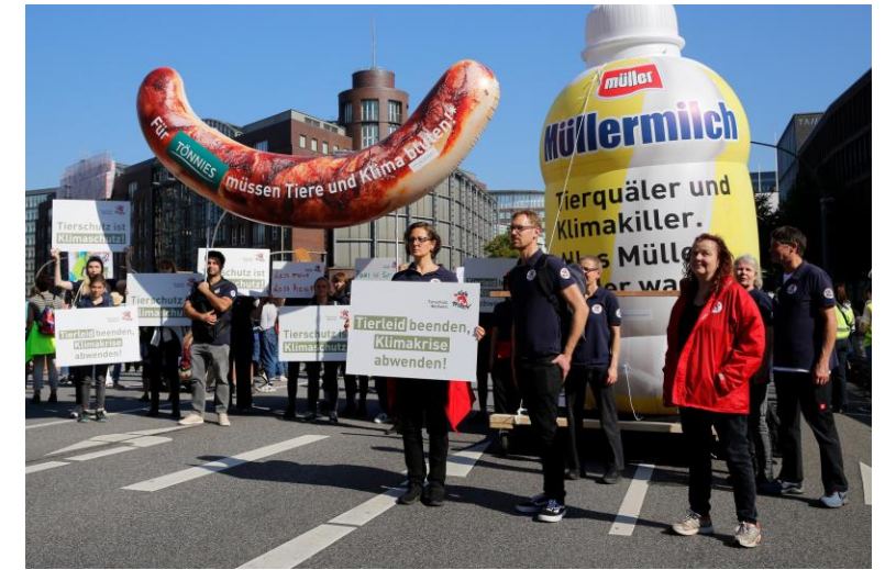
Sichtbarkeit auf dem Klimastreik mit klarer Ansage an Tönnies und Müllermilch