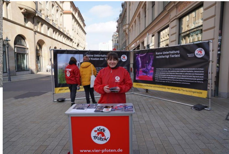
Aufklärungsaktion zu Wildtieren im Zirkus mit Fotoausstellung