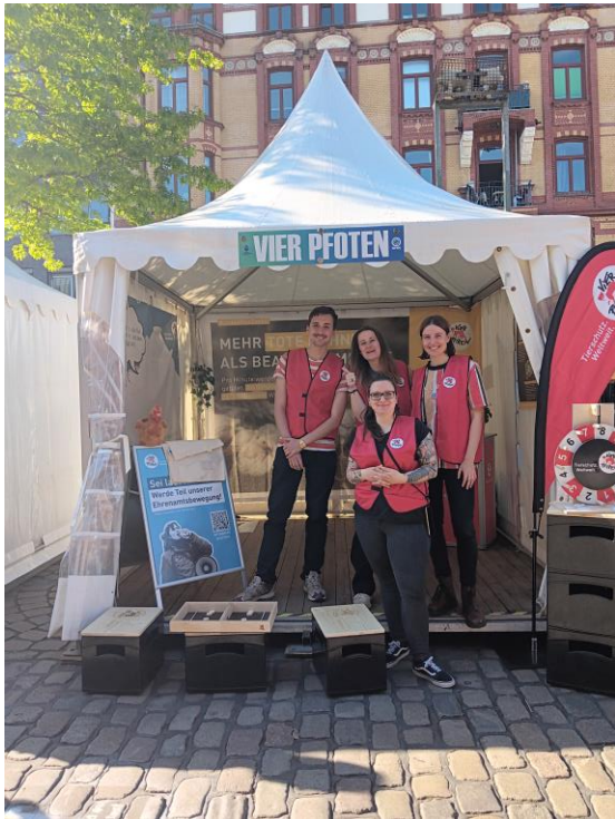
Infostand auf einem Straßenfest mit Glücksrad, Quiz und Superflitzer