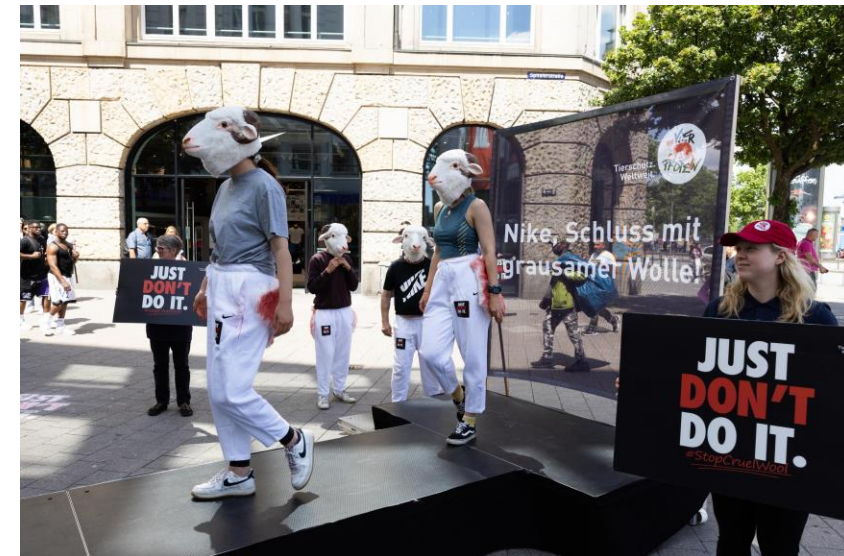
Laufsteg-Aktion, um Nike dazu zu drängen, Lämmerverstümmelung aus ihrer Lieferkette zu verbannen