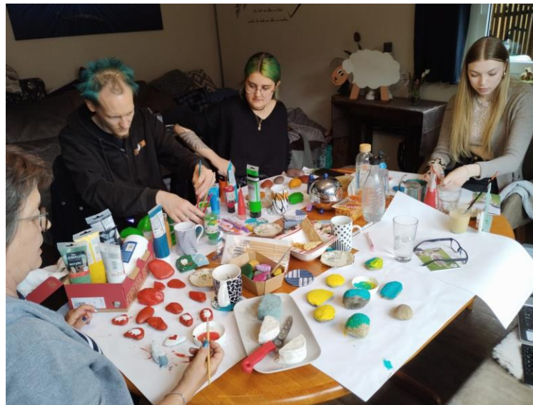
Bastelaktion zum Steine bemalen gegen Lämmerverstümmelung